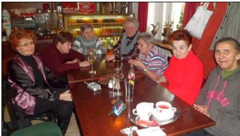
Setkání seniorů v netradičním prostředí :-)