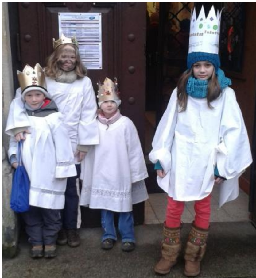
koledníci v našem kostele