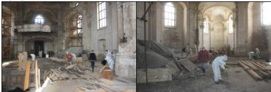
och/idz, O. Ch.

Současné aktivity děčínského zámeckého spolku v Rozbělesích finančně podporuje Komunitní nadace v Ústí nad Labem a město Děčín. Jejich cílem je upozornit na chátrající barokní památku a zároveň provést nejnnutnější technické a statické zajištění kostela, aby bylo zastaveno jeho další chátrání a stavba byla bezpečná pro případné návštěvníky. Kostel sv. Václava v Rozbělesích bude otevřen pro veřejnost stejně jako v loňském roce v rámci Noci kostelů již 27. května 2011.