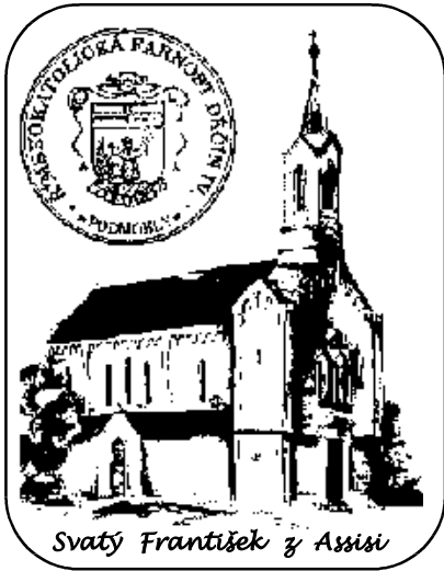
Svatý František z Assisi