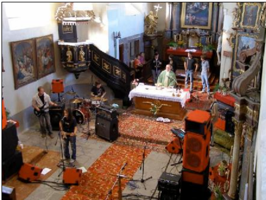
...mše, či rokový koncert?

Často slyšíme nebo čteme, že církev je také nositelkou vzdělanosti a kultury. Nejsm si však jist, zda tato slova platí ještě dnes. V případě hudby, kterou dnes slyšíme v kostelích a v křesťanských mediích, jsem skutečně bezradný. Zdá se mi, že v liturgické a duchovní hudbě přestala platit všechna hodnotová měřítká a byla nahrazena osobním vkusem.