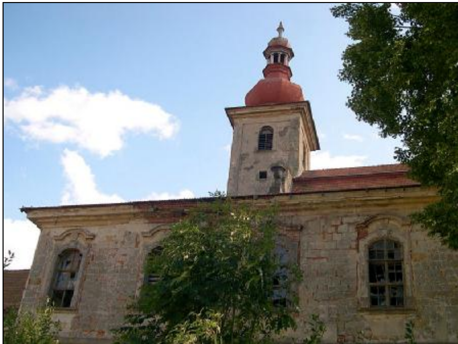
kostel Nanebevzetí Panny Marie v Konojedech

R. S. podle http://www.pamatky.ceskalipa.org/kostel/kostel.php?co=konojedy/historie