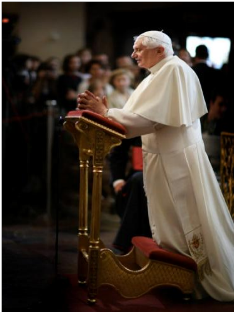
modlitba před Pražským Jezulátkem