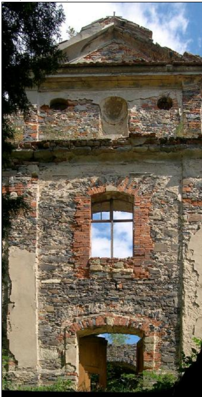
Nejsou jen chrámy z kamene - jak o ty pečujeme?