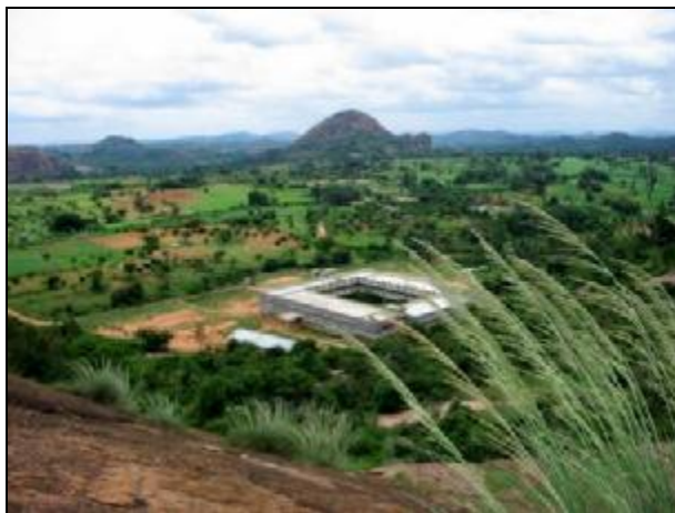
Moje středisko v Ajjanahalli