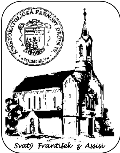
Svatý František z Assisi