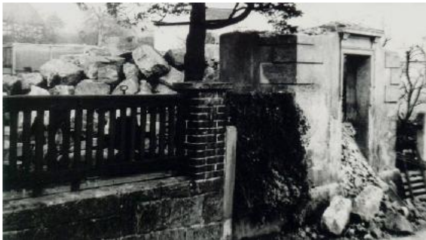
Pamětníci vzpomínáte? - Kaplička na Jalůvčí...