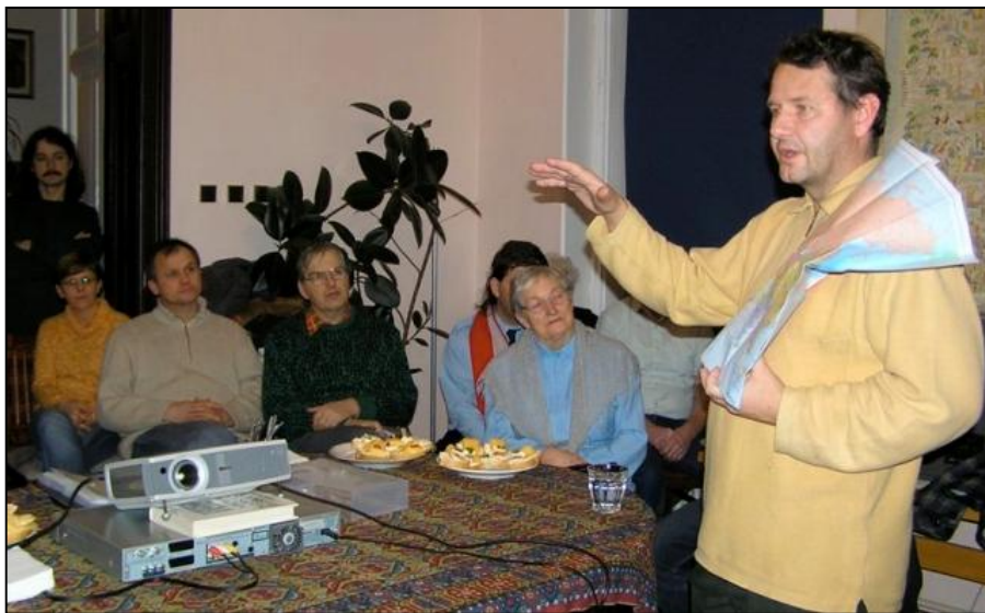
R. S.

Po úvodním vyprávění, při kterém nám byla přiblížena trasa cesty, jsme měli možnost shlédnout jednu část videa, ve kterém jsme obdivovali krásy Himaláje, posvátnou řeku Gangu, život ve městech i samotách, památky, zvyky... Po několika hodinách jsme se rozešli s tím, že by bylo dobré uspořádat ještě jeden takový večer a shlédnout i druhý díl.