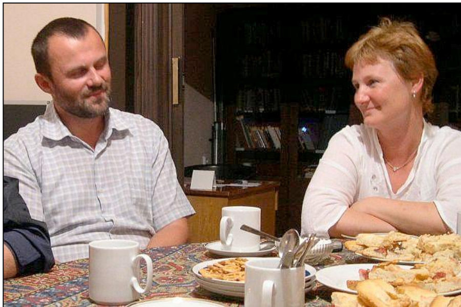
povídání i foto R. S.

Více nemá cenu psát. Můžete se podívat na právě otevřené nové internetové stránky http://www.centrumprorodinu.cz/ , na kterých naleznete mnoho zajímavých akcí. Kdo nemáte doma internet, máte možnost zajít na faru, kde je k dispozici zdarma.