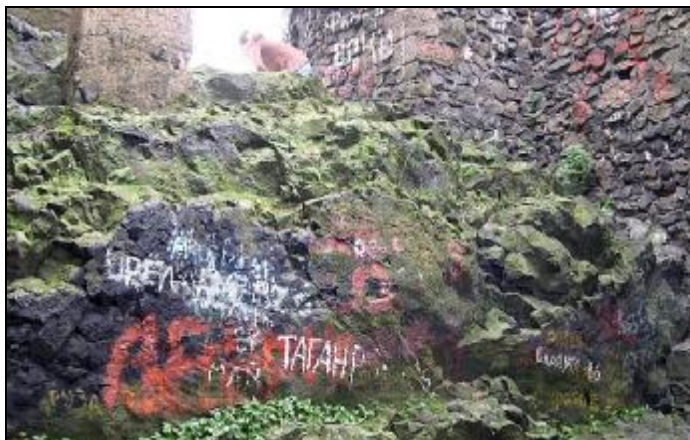
Na vrcholu Ralska se zastavil čas - přesto je tomu již 38 let...