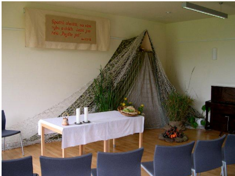
v kapli nechybělo ani ohniště pro opékání ryb...

Naším zázračným rybolovem byly i zkušenosti druhých párů a pro některé z nás se staly paprskem ve tmě. Tím, že se vždy najdou lidé, kteří se dokážou třeba i při přednášce hluboce otevřít druhým, vznikne neopakovatelná atmosféra.