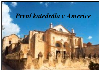
První katedrála v Americe

Přes všechny vpády pirátů, zemětřesení i časté hurikány se jich do dneška velké množství zachovalo. Historické centrum Santo Dominga dokonce UNESCO zařadila mezi památky světového významu. Takzvaná „Zóna Colonial“, nebo-li staré město je nejdochovanější částí. K objevení ostrova dochází 5. prosince 1492 při první výpravě admirála Kryštofa Kolumba během jeho cesty do domnělé Indie. Vlastní město Santo Domingo je pak založeno jeho bratrem Bartolomějem 5. srpna 1496 na východním břehu řeky, dělicí nynější hlavní město na dvě části. Tím se stává historicky prvním městem založeným na Americkém kontinentu a tomu odpovídal i odpovídá jeho význam.