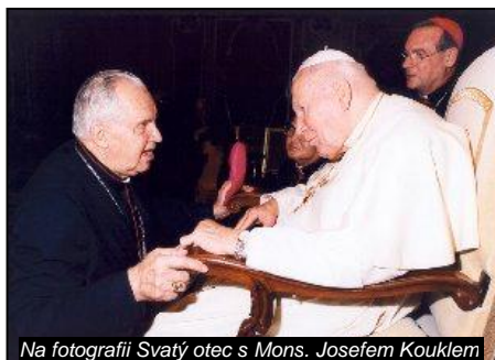
Na fotografii Svatý otec s Mons. Josefem Kouklem

Papež Jan Pavel II. zemřel 2. dubna 2005 ve 21:37, po 26 letech, 5 měsících a 17 dnech svého pontifikátu.