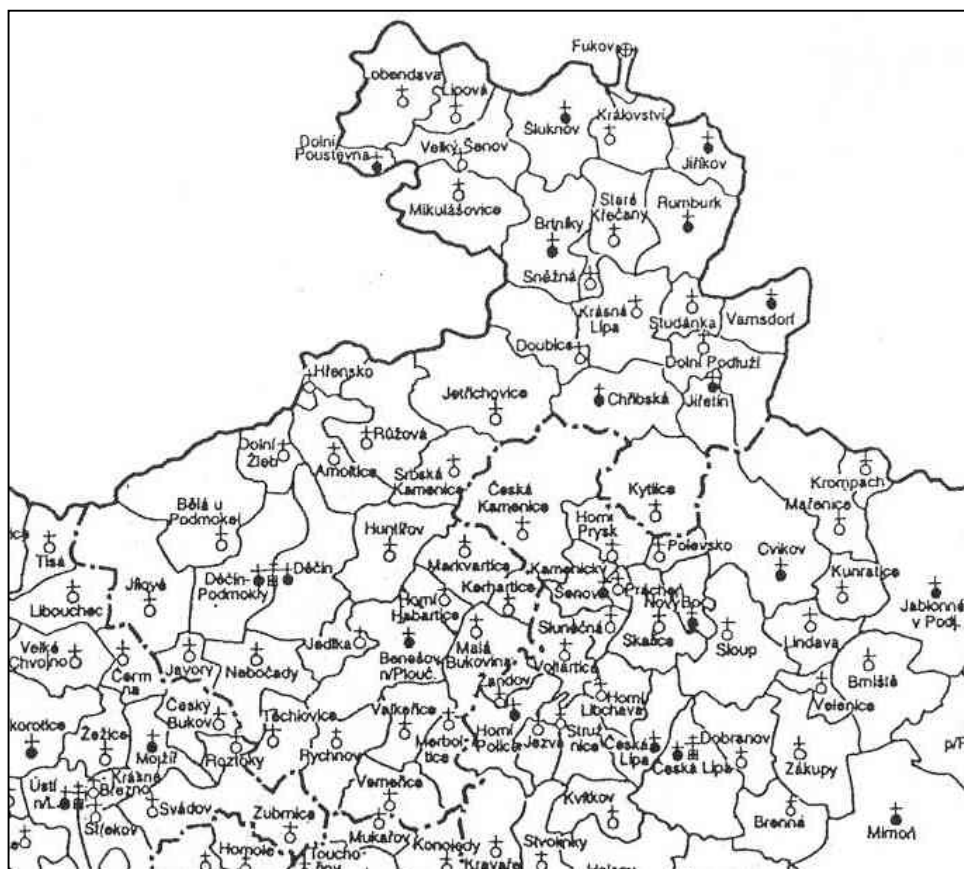
► výřez z mapy litoměřické diecéze z roku 1996 ◀