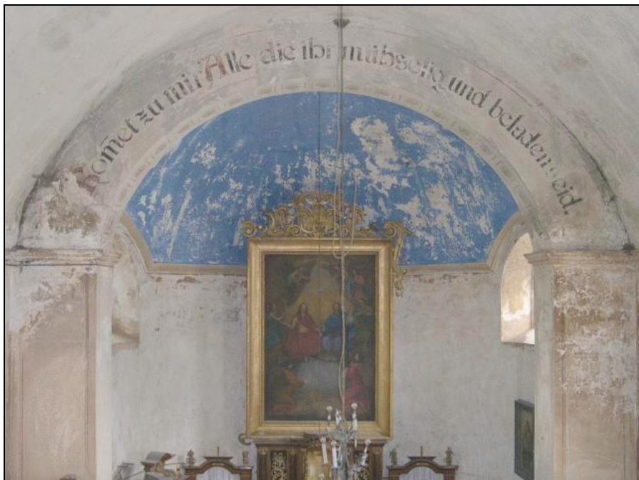
Po poslední pobožnosti v Dolním Žlebu