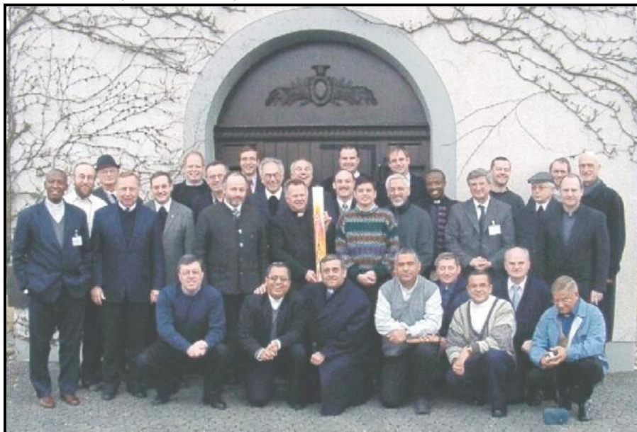
spodní řada, 5. zleva ...