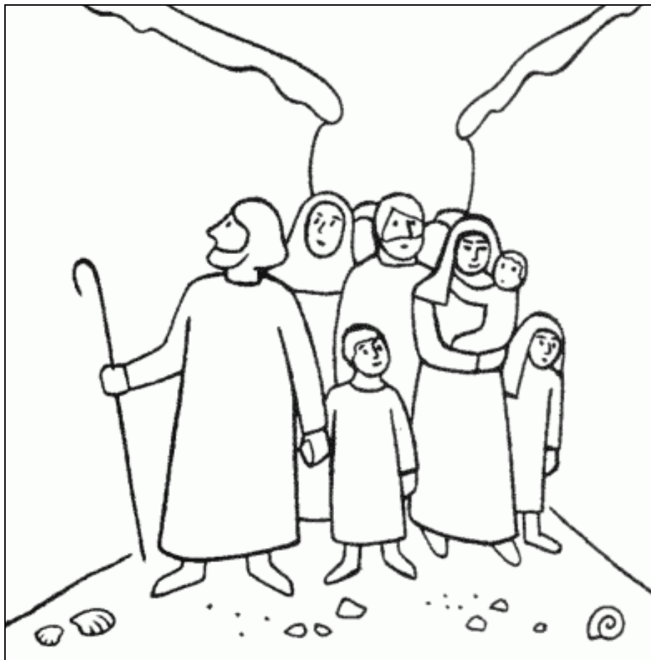
Přechod přes moře (2. Mojž. 14, 21-22)