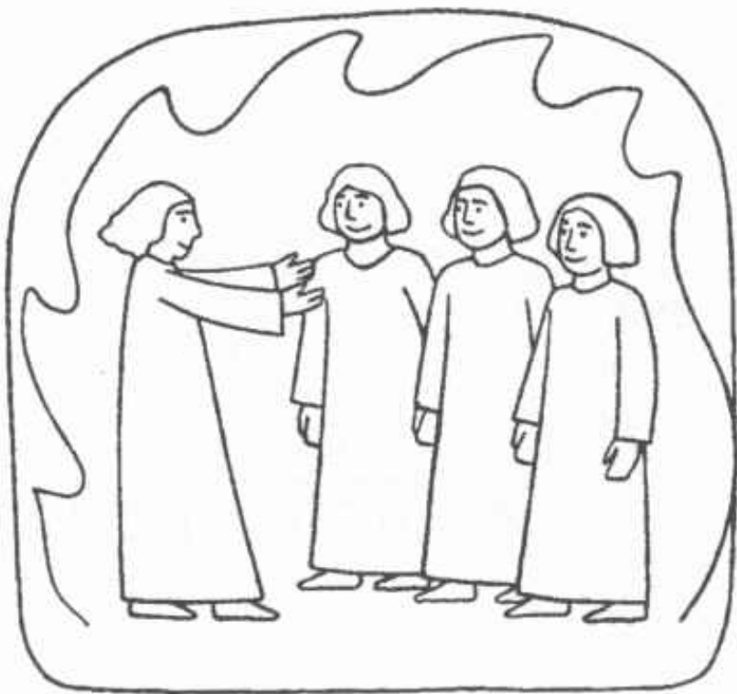
Mládenci v ohnivě peci (Dan. 3, 1-30)