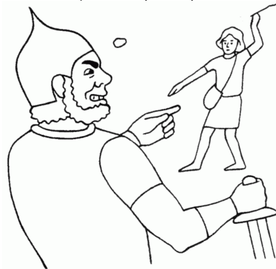
David a Goliáš (1. Sam. 17, 1-50)