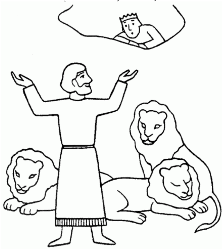
Daniel ve lví jámě (Dan. 6, 1-28)